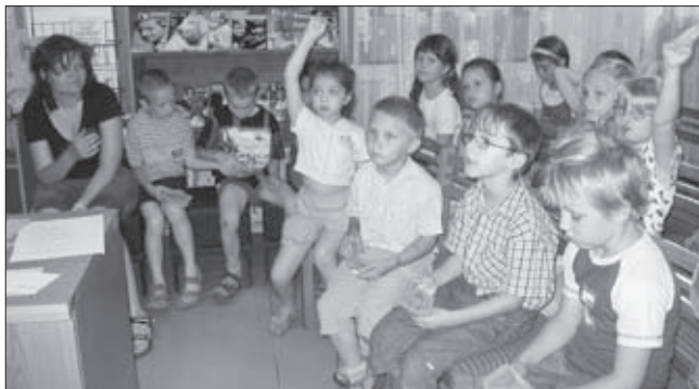
První návštěva prvňáčků – čtenářů v knihovně MKS

Pracovníci Městského kulturního střediska Adamov přejí dětem i dospělým krásné léto naplněné odpočinkem, poznáváním krás a zajímavostí u nás i v cizích zemích a těšíme se na viděnou při kulturních akcích, které pro vás připravujeme.