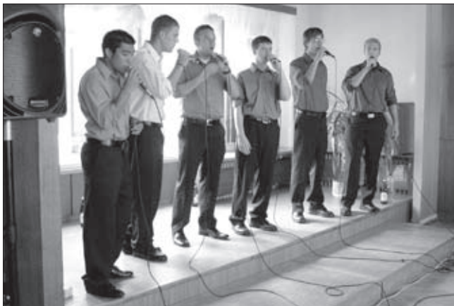
Koncert skupiny Biola z USA

Nádherné dny plné příjemného sluníčka a odpočinku na letní dovolené, dětem prázdniny plné krásných a nezapomenutelných zážitků a všem občanům kouzelné léto tak akorát, vám přeje představitel města Adamov a Kulturně informační komise.