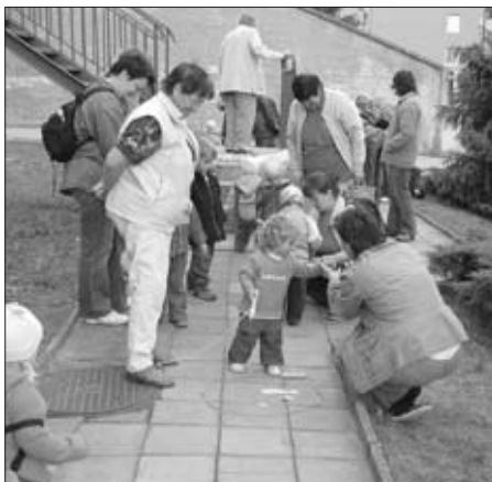
Oslava MDD – Dopoledne pro nejmenší