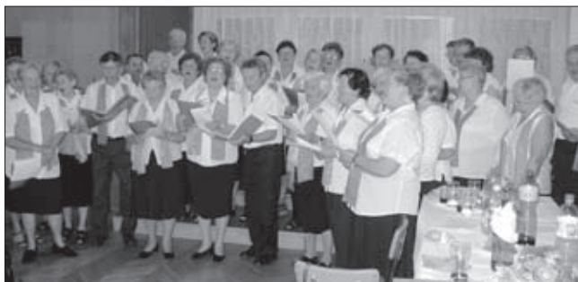
Návštěva družebního KD z Bratislavy