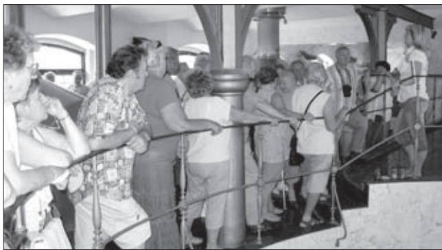
Exkurze do pivovaru v Černé Hoře