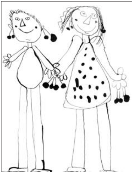
J. VEČEŘOVÁ, 5 LET

I děti si mohly na vlastní kůži vyzkoušet, jak se cítí naši nevidomí spoluobčané.