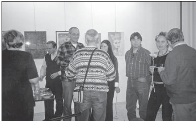
Fotografií se vracíme k loňské výstavě Salon adamovských výtvarníků.