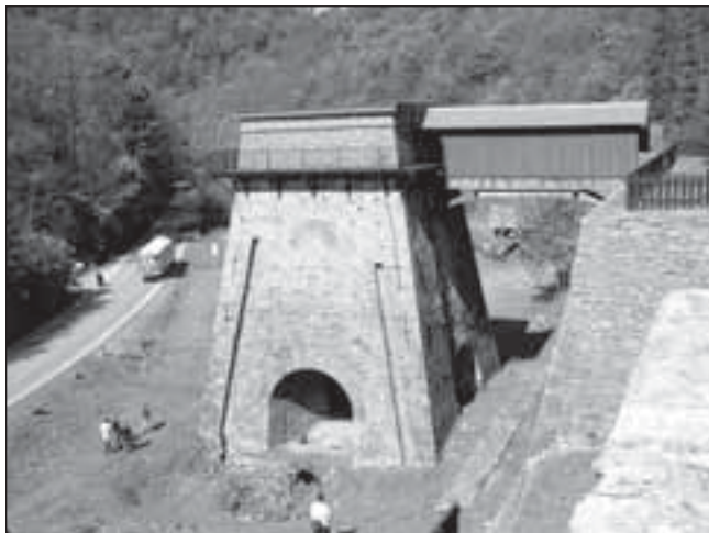
Dne 14. května se konal Den parků a muzeí.

Není bezpečnějšího přírodního zákona nad zákon Medardův. (Vladislav Vančura)