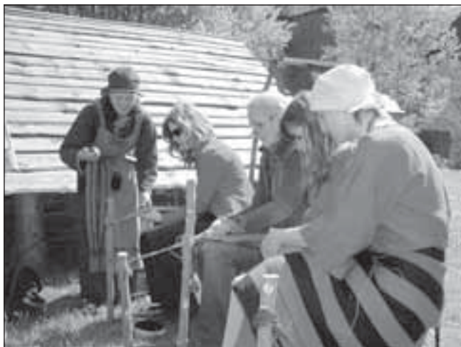
Návštěvníci si mohli vyzkoušet středověký způsob tkaní.

Srdečně Vás všechny zveme na tyto koncerty, které Vám budou pohlazením na duši v tak úspěšné době. Přijďte i Vy, kteří váháte s přihlášením Vašich dětí do Základní umělecké školy. Sami se přesvědčíte, že díky uměleckému školství dáváte Vašemu dítěti to nejlepší do života jak po stránce estetické, tak etické.