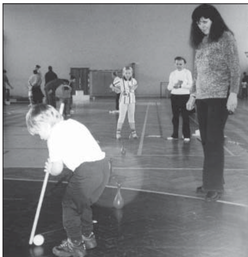
Děti plnily určené úkoly.