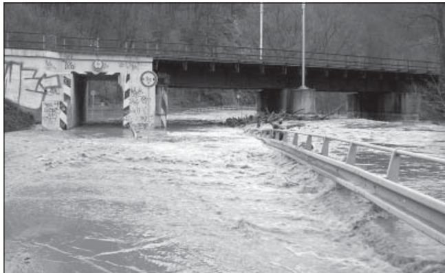
Přicházející jaro přináší nejen radosti, ale i problémy. Ve dnech 18. až 20. března je přinesla feka Svitava. Na snímku je podjezd pod železnici za Adamovem směrem na Bílovice.