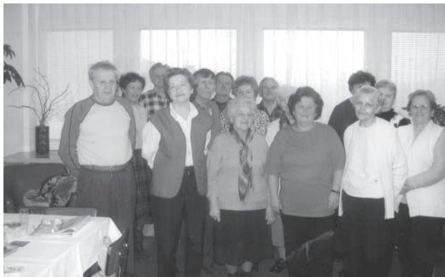
Kroužek Zpívání pro radost svými vystoupeními zpestřil řadu akcí.