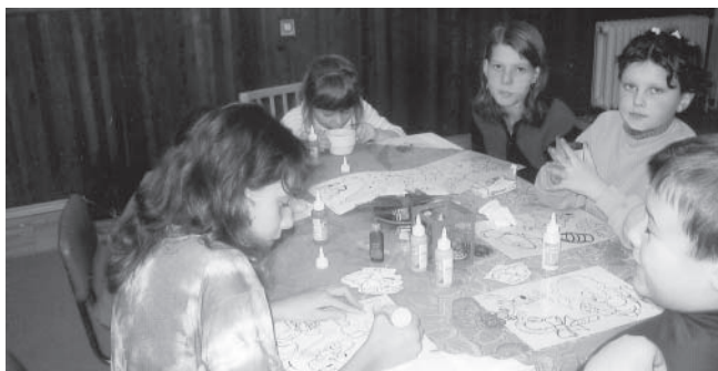
Vánoční dílna zájemce přivítala 12. prosince.