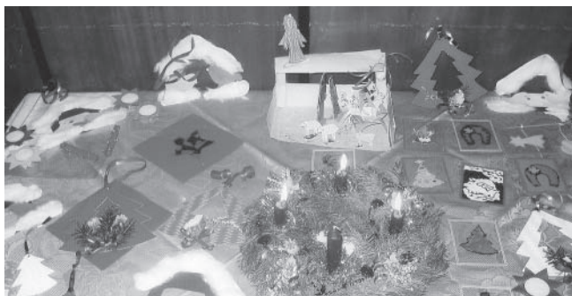
Výsledek snažení návštěvníků Vánoční dílny.