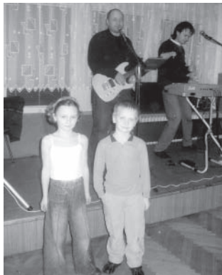
Vítězný taneční pár zábavného odpoledne pro školáky.

Mateřské centrum ADÁMEK: schůzky i nadále v úterý od 15.30 h (změna začátku)