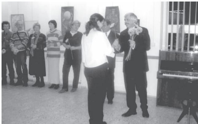
Vernisáž výstavy Galerie adamovských výtvarníků.