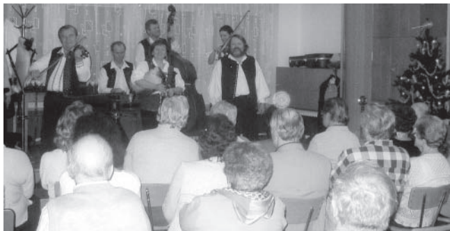
Vánoční vzpomínání, to byl večer se sólisty BROLNu Brno.